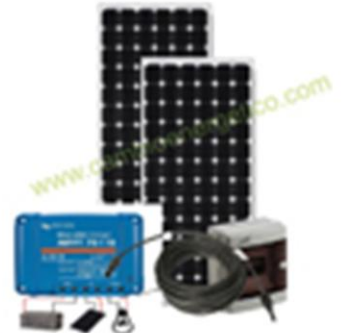
KIT SOLARES DE AMPLIACIÓN